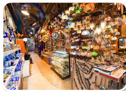
Grande Bazar – Istambul