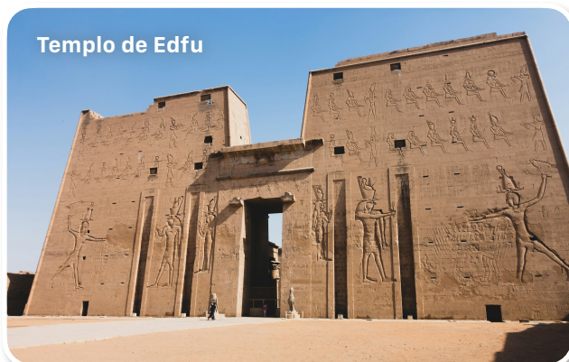
Templo de Edfu

Para este roteiro, o passaporte deverá ter validade até Dezembro/2025. É necessário visto de entrada no Egito que será solicitado pela Magnificat. Também é necessário a Vacina da Febre Amarela para entrar no Egito.