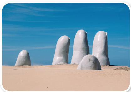
Punta Del Este