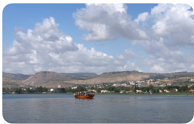
Mar da Galiléia

Av. Itália, 277 Sala 509 – 95.010-040 – Caxias do Sul – RS – Brasil