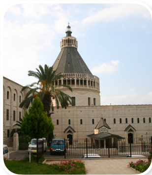
Basílica da Anunciação